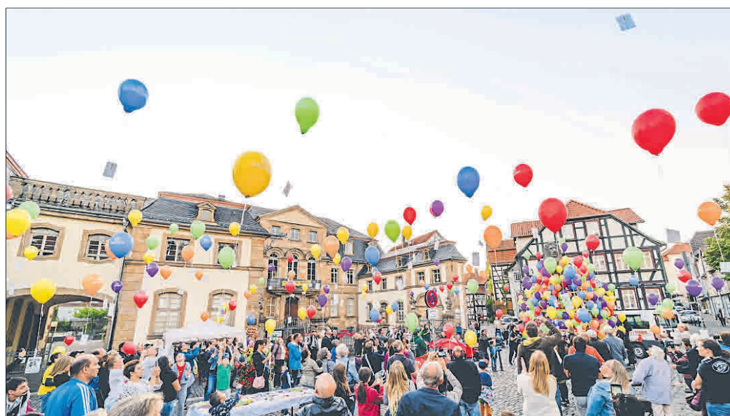
600 Luftballons stiegen über der Kreisstadt auf.