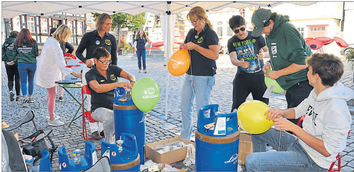
Stadtjugendparlament und SI arbeiten Hand in Hand für die Vorbereitung der Friedenswunsch-Ballonaktion.